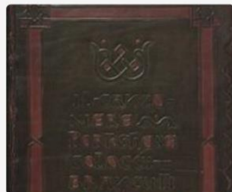
Biblioteca Nacional de Portugal

La UNESCO ha colgado en Internet el acceso a la Biblioteca Digital Mundial , creada por la Biblioteca del Congreso de Estados Unidos y la UNESCO. De esta manera, pretenden contribuir a la difusión de la cultura estos días de confinamiento en buena parte del mundo. La oferta que presenta esta plataforma es muy extensa, con fotos, mapas interactivos, manuscritos, grabados, artículos, películas o grabaciones de cualquier lugar, periodo de tiempo y tema que se desee