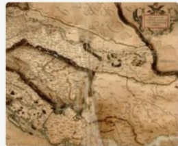
Biblioteca Nacional y Universitaria de Bosnia-Herzegovina 5 artículos